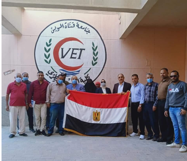
انتخابات مجلس النواب