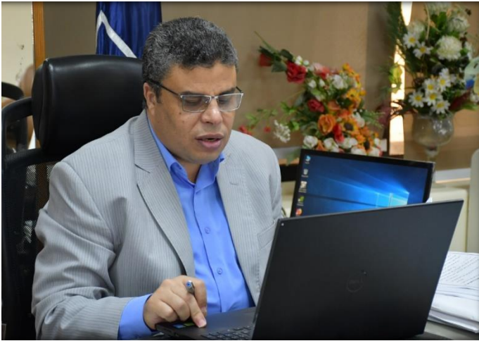
أ.د. / محمد حسن شقيدف نائب رئيس الجامعة لشؤون التعليم والطلاب

القائم بعمل رئيس جامعة قناة السويس ونائب رئيس الجامعة لشؤون خدمة المجتمع وتنمية البيئة