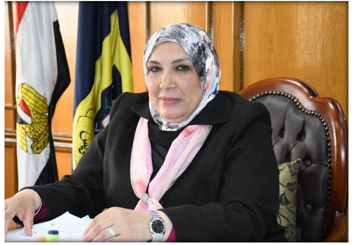
أ.د. / ماجدة محمد هجرس نائب رئيس الجامعة لشؤون الدراسات العليا والبحوث